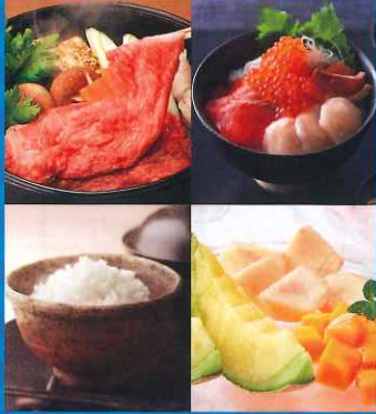
リンベル カタログギフト 美味百撰 李(すもも)