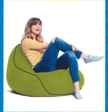
Yogibo Lounger (ヨギボー ラウンジャー)